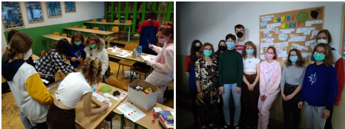
Obr. č.1, 2: Spolupráca žiakov pri riešení spoločnej problémovej úlohy

bestpractice z aplikovania nových progresívnych metód a foriem práce, v oblasti prevencie závislostí, rasizmu, násilia a iných foriem extrémneho správania. Na Obr. č.1, 2 môžeme vidieť spoluprácu žiakov Biologického workshopu pri tvorbe nástenného panelu venovaného aktuálnej problematike pandémie covid-19.